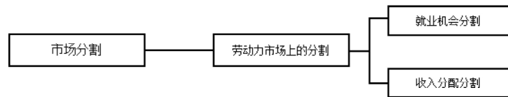
图1 市场分割理论框架

2. 研究的范畴不同。分割理论通常只研究发生于劳动力市场上的就业机会和收入分配规则的不一致。而歧视理论不仅研究劳动力市场上的规则不一致,还研究劳动力市场外——市场前的接受教育、进入市场后和劳动相关的各项社会保障权利赋予规则的不一致。因此,歧视理论研究的范畴要大于分割理论(图1、图2)。